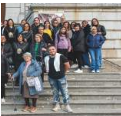
ostolo ( Ricigliano) ni Galluzzo