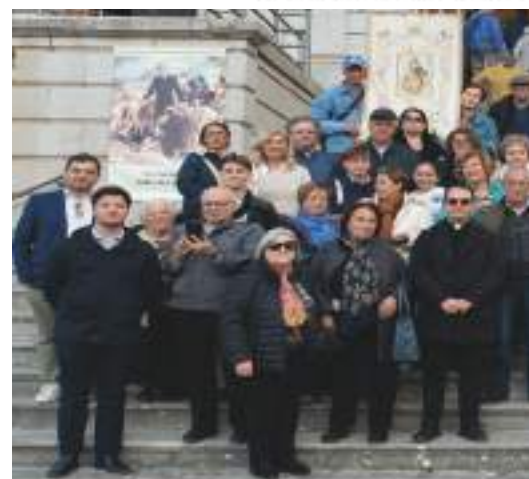
Parrocchia Beata Vergine del C Parrocchia Santa Maria con Don jos