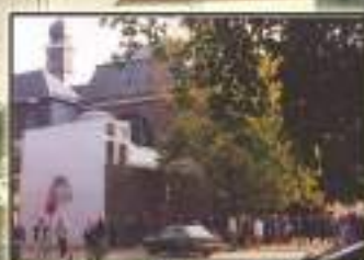
Wittem - Olanda