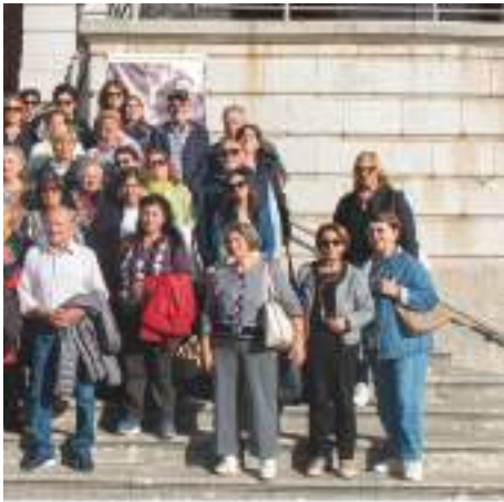
opoli - Santa Maria a Favore e el San Giorgio) sco Sessa