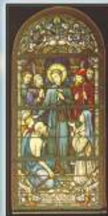
Cham - Germania