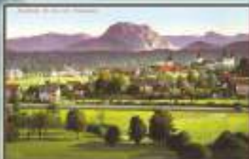
Traraluen - Austria