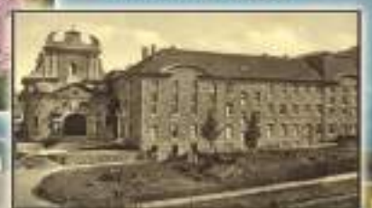
Mousson - Belgio