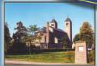
Weebosch - Netherlands