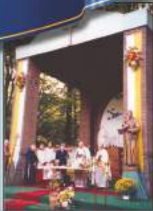
Weebosch - Netherlands