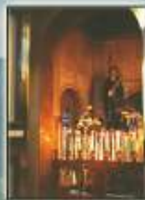
Wittem - Olanda