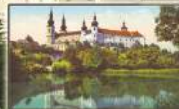
Traraluen - Austria