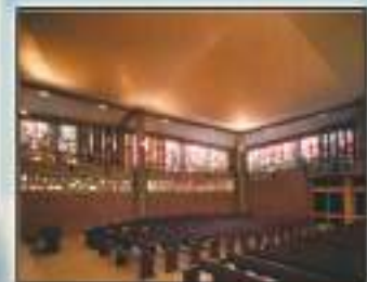
Aluche - Madrid