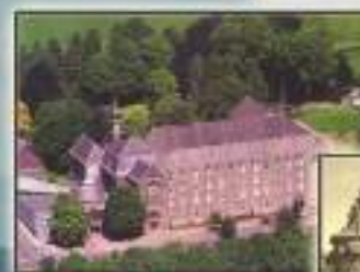
Wittem - Olanda