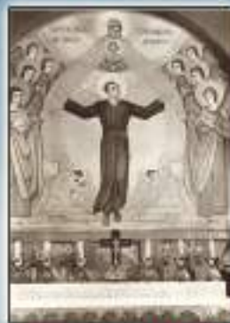
Haguenau - Francia