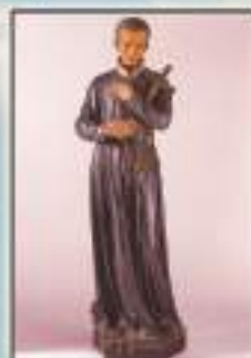
Wittem - Olanda