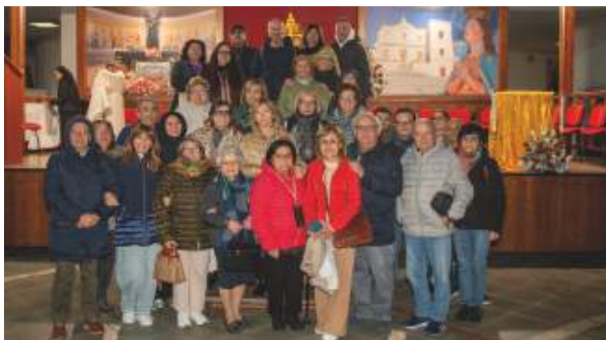
Parrocchia Beata Vergine Maria del Buon Consiglio